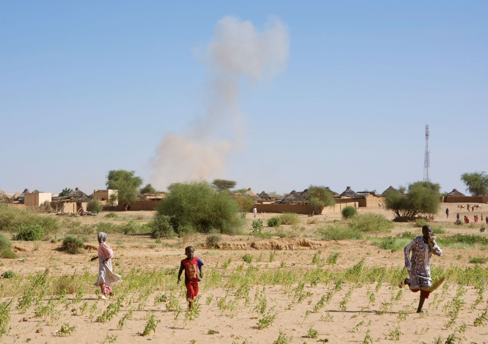
© ↑ Des enfants fuient une attaque de drone des FAR dans une zone rurale du Darfour septentrional (Soudan), octobre 2025 © DR

Des habitant.e-s des alentours d'Abu Zerega ont fourni une liste de 122 personnes tuées lors des attaques de décembre 2024, dont sept enfants. Amnesty International a pu vérifier en toute indépendance la mort de 13 des victimes de cette liste et a reçu les noms de 15 autres personnes tuées, dont cinq étaient mineures. À propos des attaques de mars 2025, l'organisation a recueilli les noms de 21 personnes qui avaient été tuées, dont trois adolescents. L'écrasante majorité des personnes tuées et blessées au cours de ces offensives étaient des hommes et des garçons.