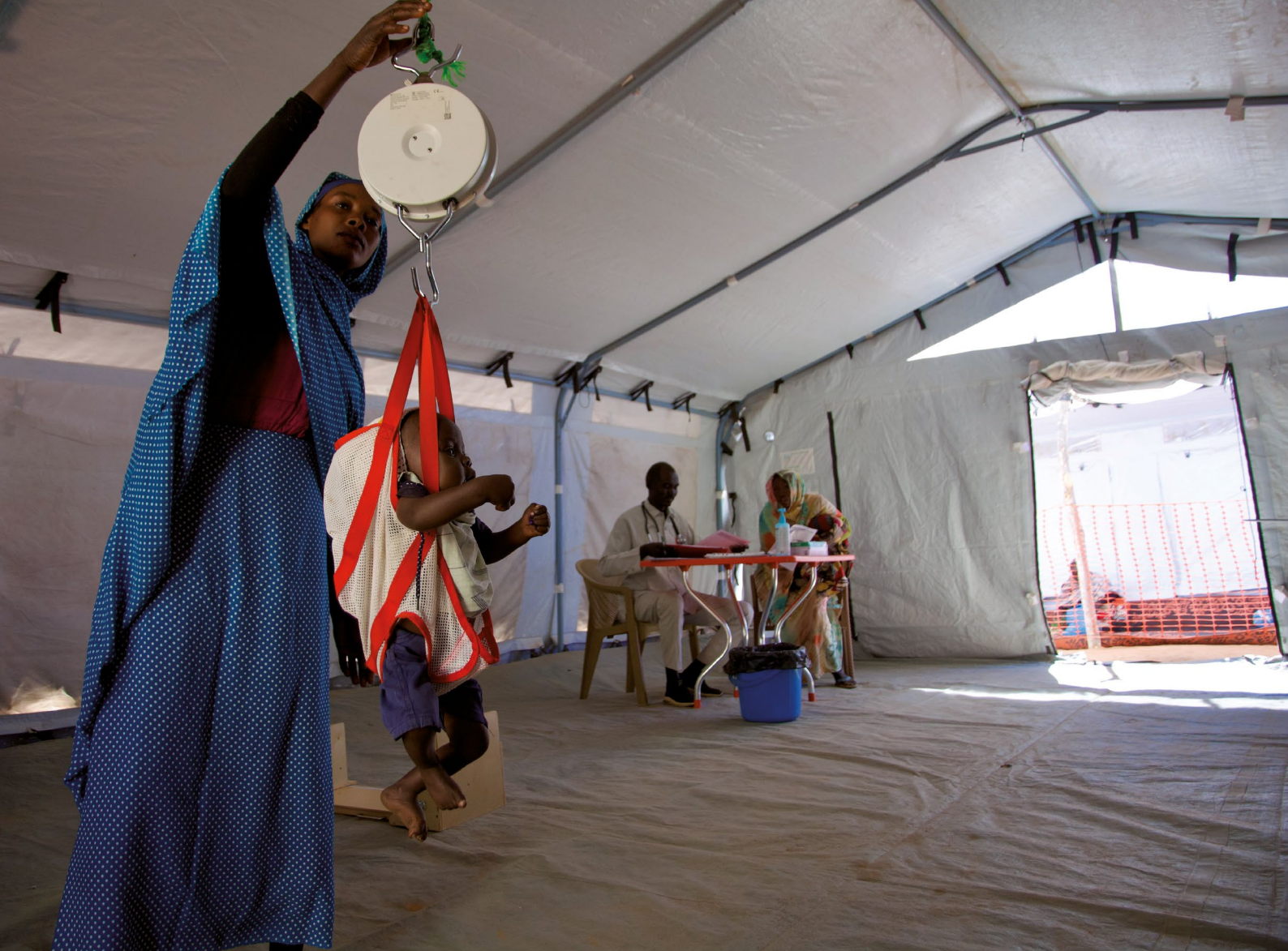
© ↑ Un enfant est pesé dans un centre de nutrition à Garni (Soudan), qui a été ouvert après la prise d'El Fasher par les FAR en octobre 2025, janvier 2026 © DR

la fuite des civil-e-s extrêmement difficile, bloqué les voies d’approvisionnement de la ville et empêché les négociant-e-s, les organisations humanitaires et d’autres d’y faire entrer des biens de première nécessité.