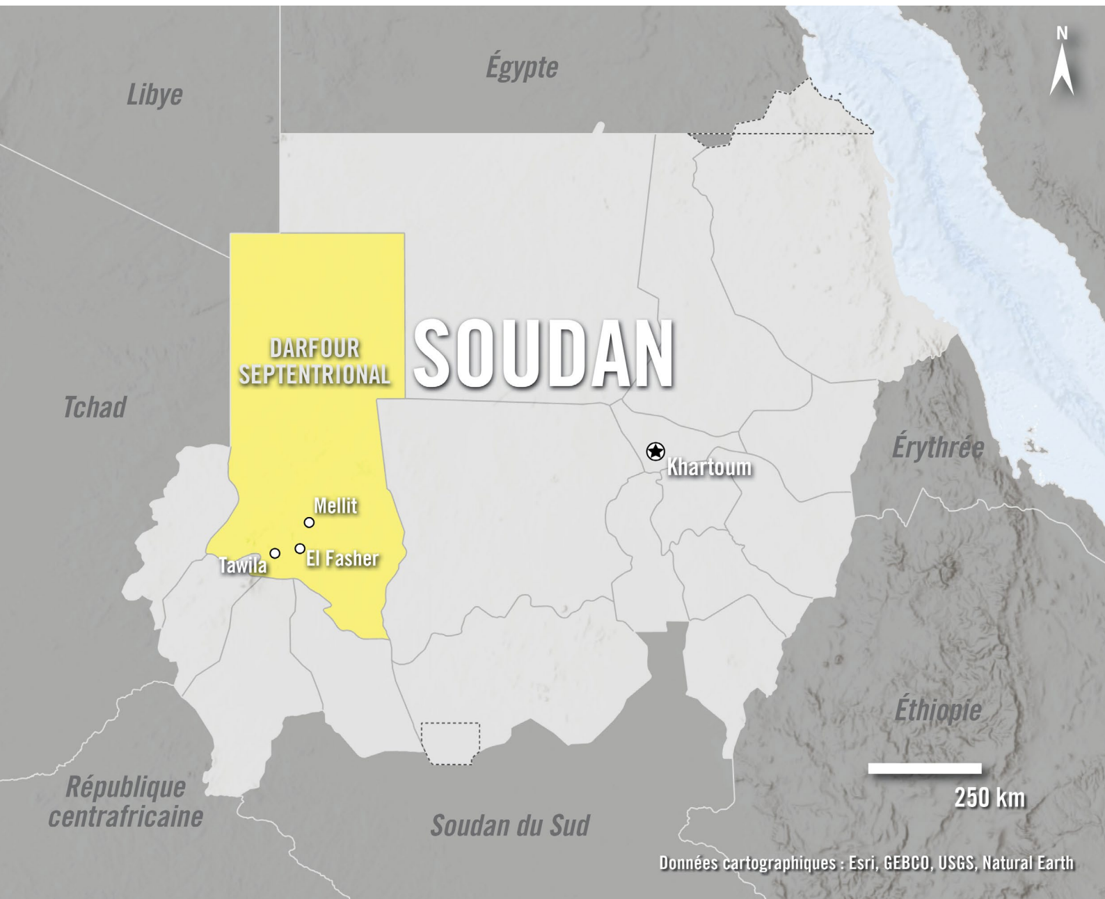
© ↑ La carte ci-dessus montre l'État du Darfour septentrional et ses principales villes.