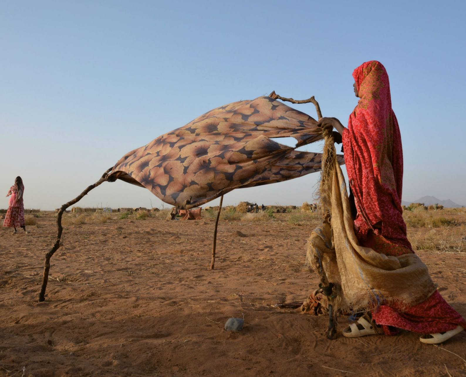
© ↑ Une femme déplacée d'El Fasher construit un abri avec certains de ses vêtements dans le camp de personnes déplacées de Tawila Omda à Tawila (Soudan), mai 2025 © DR

Une femme, une fille et une jeune femme enlevée quand elle était mineure ont été retenues prisonnières en tant qu'esclaves sexuelles pendant des périodes comprises entre quelques jours et plusieurs semaines. Toutes trois ont subi des viols en réunion ; deux ont été violées à plusieurs reprises.